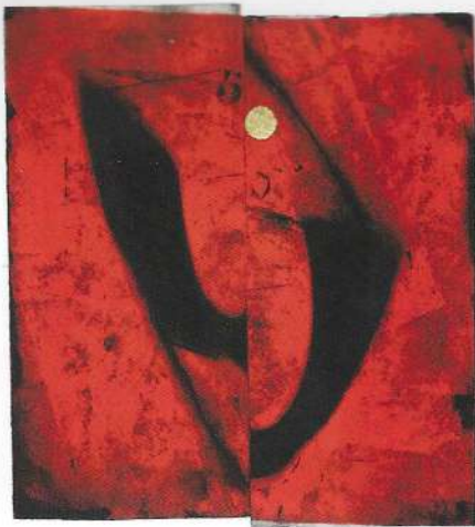
No. 5024, 50 x 45 cm, 2010